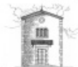
Sant'Antonio da Padova al Romito