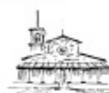
Santo Stefano in Pane a Rifredi